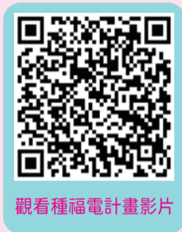
觀看種福電計畫影片

【2023第七屆種福電計畫】希望籌募500萬，為「財團法人天主教華光社會福利基金會附設由根山居」於自有屋頂建構太陽能板，預計20年發綠電近180萬度，相當於為地球減少二氧化碳991公噸；這些綠電賣給台電，20年下來可幫助華光基金會獲得約980萬收益，讓愛心放大2倍！此外，捐款者每購買一片太陽能板，台灣大哥大即購買等量綠電，為台灣的土地種下更多綠電。