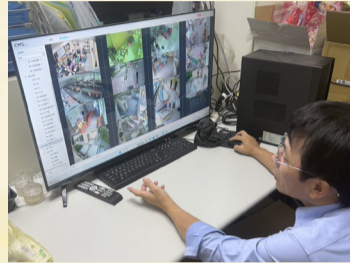
全區監視器設備更新