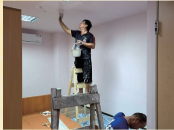
全區內部油漆粉刷

今年度全體團隊共完成 24 項修繕與設備升級工程，大幅提升整體場域安全性與使用品質，亦為下一階段的服務發展奠定穩固基礎。