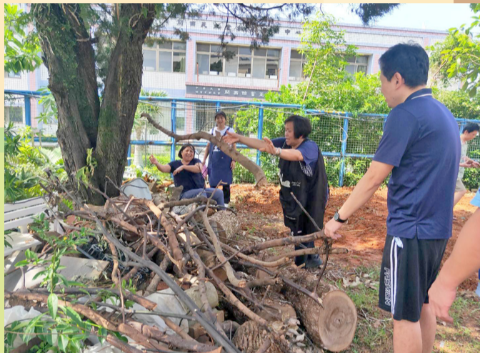
教保員帶著服務對象共同維護家園