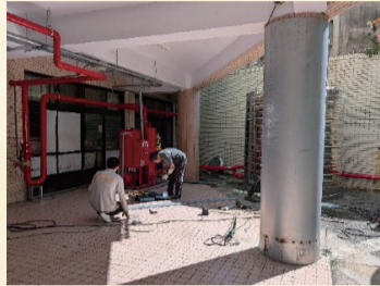
消防灑水系統裝設